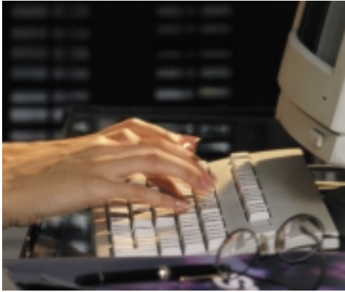
Visualisation de la page scannée

Enfin certains documents, altérés ou anciens ne facilitent pas la reconnaissance de caractère, le mode utilisateur de NewsCLIP permet alors de paramétrer la reconnaissance de texte afin de l'optimiser.